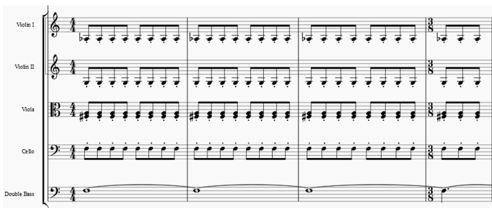
Exemplo 1: Réquiem Contestado . Cluster com centralidade na nota Sol. Kyrie (c. 1-4).

No Introitus , por exemplo, a progressão harmônica é majoritariamente preenchida por tríades menores, que se repetem em frases de oito compassos. Os acordes maiores pontuam as passagens de súplica do texto e que fazem referência à luz. No Kyrie , há instabilidade nos primeiros compassos. A centralidade e simetria em torno da nota Sol, que funciona como eixo do cluster , cujas notas que o compõem estão um tom acima (Lá) ou um tom abaixo (Fá), na região grave, gera densidade, que é reforçada com a entrada do coro, em uníssono, na mesma área (Exemplo 1).