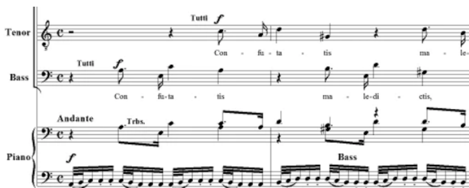
Exemplo 6: Requiem , de Mozart. Confutatis (c. 1 e 2).

Musicalmente, encontra-se uma referência ao Confutatis , de W. A. Mozart, no movimento homônimo, no Réquiem Contestado , notadamente no uso da figuração rítmico-melódica. A comparação entre os Exemplos 4 e 6 revela tais similaridades, sobretudo a compressão rítmica do tema gerador.