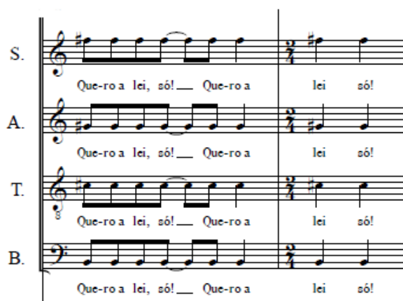
Exemplo 7b: Réquiem Contestado. Gloria (c. 42 e 43).