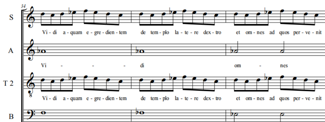
Exemplo 2: Réquiem Contestado . Figura retórica musical para representar a água escorrendo. Kyrie (c. 34 e 35).

No tocante ao ritmo, o compositor encontra soluções que contribuem para gerar instabilidade, incluindo mudanças métricas constantes, contratempos e hemíolas. Alguns movimentos, com caráter mais agitado, possuem ostinati , que ganham mais destaque por conta das articulações (Exemplo 3).