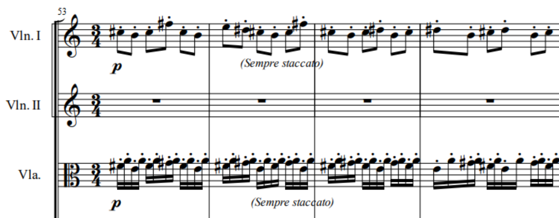
Exemplo 3: Réquiem Contestado . Ostinato rítmico e articulado. Non Credo (c. 53 a 56).

No tocante ao ritmo, o compositor encontra soluções que contribuem para gerar instabilidade, incluindo mudanças métricas constantes, contratempos e hemíolas. Alguns movimentos, com caráter mais agitado, possuem ostinati , que ganham mais destaque por conta das articulações (Exemplo 3).