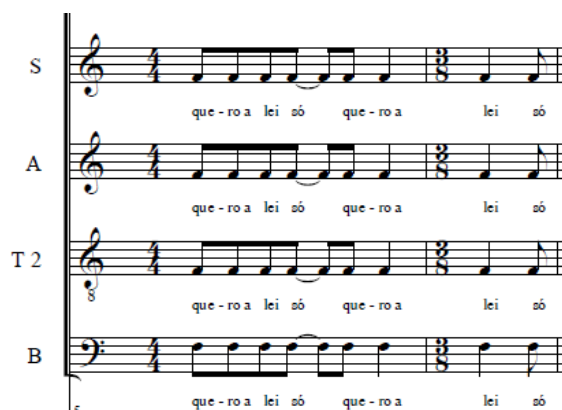
Exemplo 7a: Réquiem Contestado. Kyrie (c. 5 e 6).