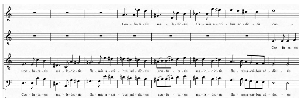
Exemplo 4: Réquiem Contestado . Contraponto imitativo. Confutatis (c. 6 a 13).

nos momentos mais líricos, cria uma atmosfera intimista. Esse procedimento também pode ser observado na definição das texturas, no contraste entre passagens homorrítmicas e contrapontísticas, destacando-se, nesse cenário, o Confutatis , cuja disposição das vozes alude a um fugato (Exemplo 4).