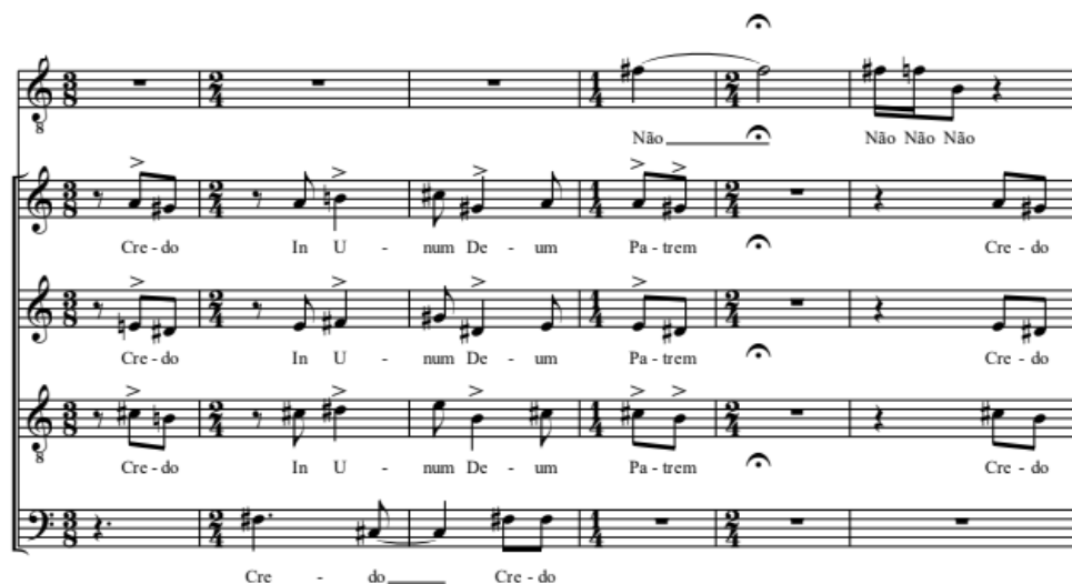
Exemplo 5: Réquiem Contestado . Intervenção do solista no Non Credo (c. 44 a 49).

Um dos destaques do Réquiem Contestado é a presença do narrador. Em vários momentos, ele encarna o papel da humanidade, questionando as ações, os castigos, as condenações, enfim, a arbitrariedade das ações divinas. Noutros, fala como o próprio Deus, especialmente na conclusão da obra, quando dá à humanidade o seu veredicto final. O narrador e o solista agem conjuntamente no Non Credo . Enquanto o coro canta o texto tradicional do credo da missa, afirmando suas crenças, eles intervêm, negando-as, argumentando por quais razões não creem nos julgamentos do Criador (Exemplo 5).