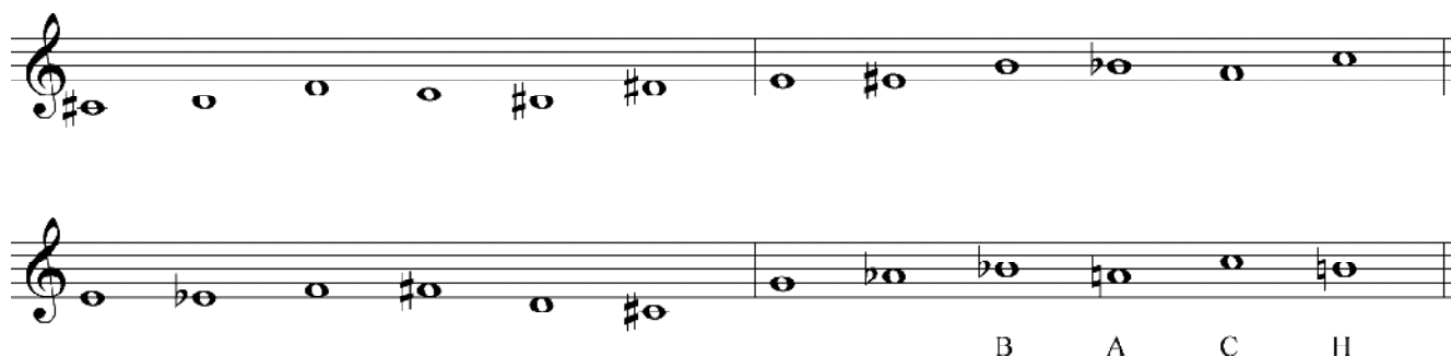
Ex.12. Duas séries da Paixão : a primeira série está baseada no hino Œwięty Boże e a segunda tem, no segundo hexacorde, o motivo BACH.

nas alturas de cada hexacorde, sendo que, na segunda série o Si natural, em vez de ocupar a nona posição, é a sua última nota (NEWMAN, 2002).